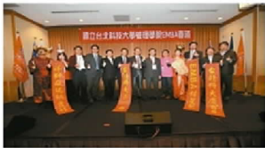
[ 2016-04-06 ] 北科大EMBA 開設桃園學分班