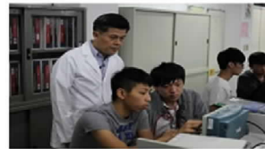
[ 2016-03-25 ] 四技申請第一階段出爐 滿級分生搶進北科、台科獎