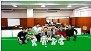
[ 2016-04-07 ] 學者領設產學平台 落實智慧工廠