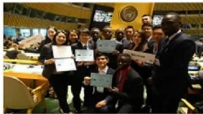
[ 2016-03-31 ] 技職生也做得好! 模擬聯合國競賽 北科大專4獎